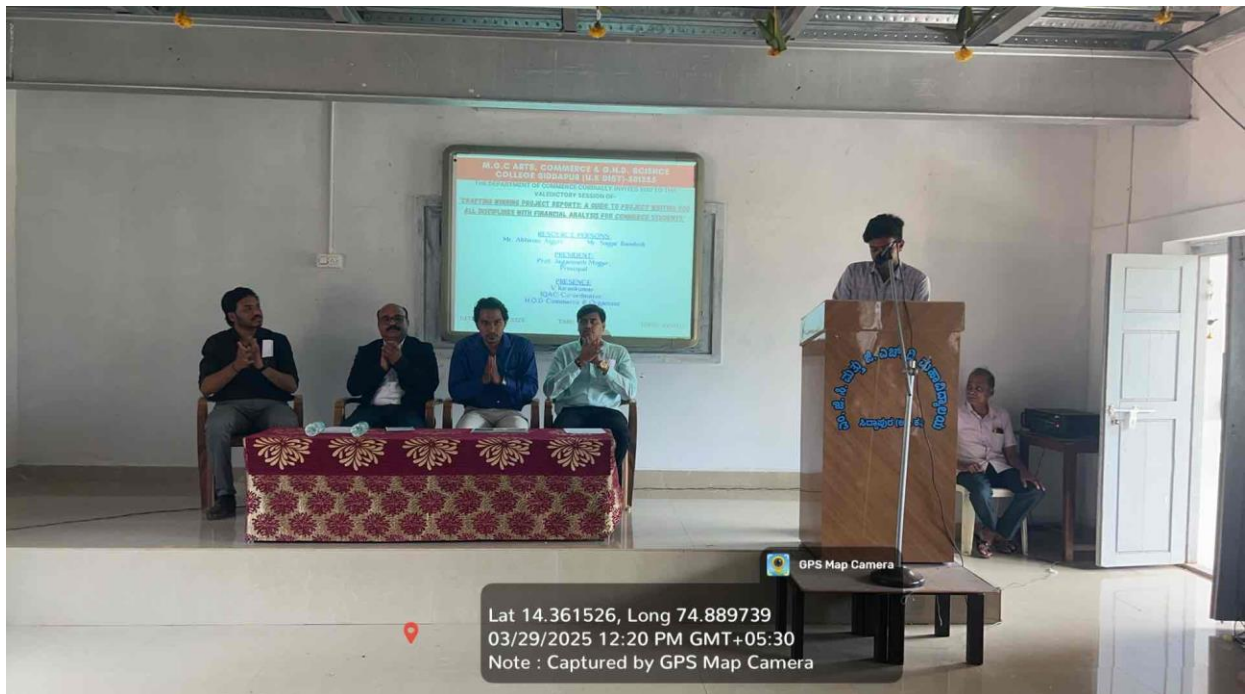
Session Feedback by students